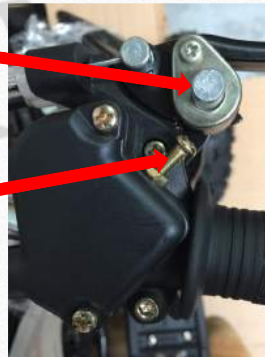
Vis de bridage Vissez afin de limiter la vitesse